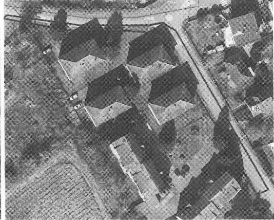
Rue du Nord