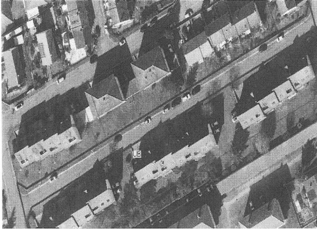
Rue du Loir