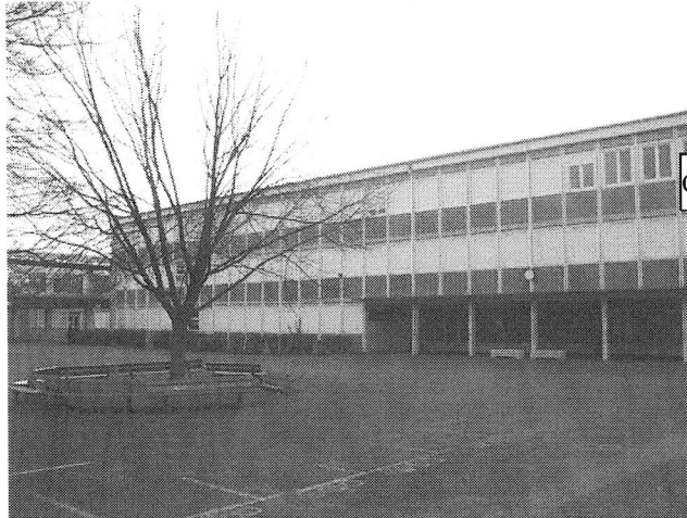
Collège Capitaine Dreyfus de Rixheim