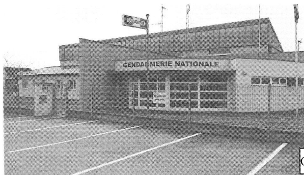
Gendarmerie de Rixheim