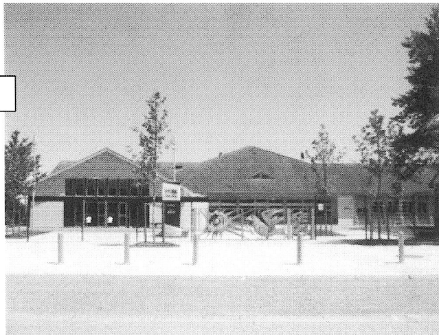
Collège Henri Ulrich de Habsheim