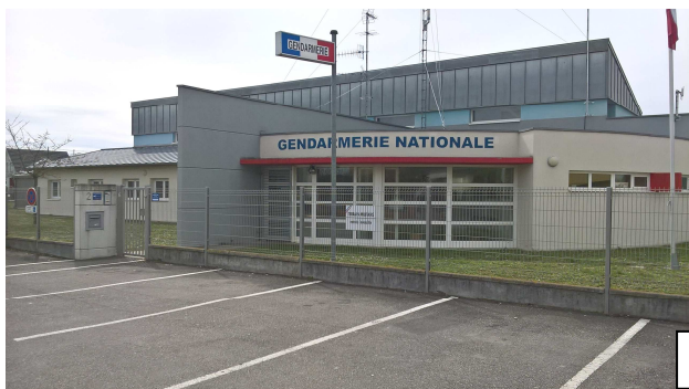
Gendarmerie de Rixheim