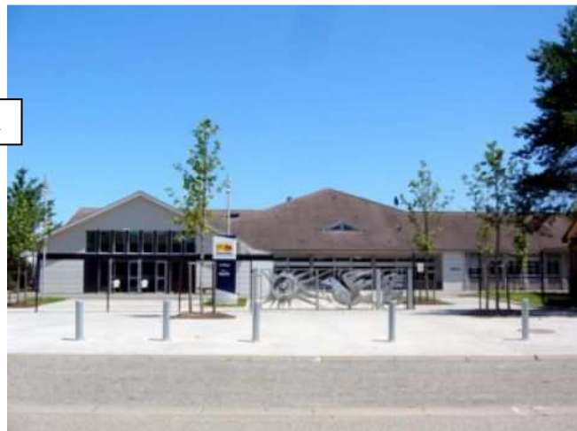
Collège Henri Ulrich de Habsheim