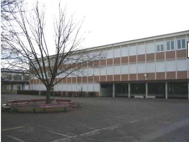
Collège Capitaine Dreyfus de Rixheim